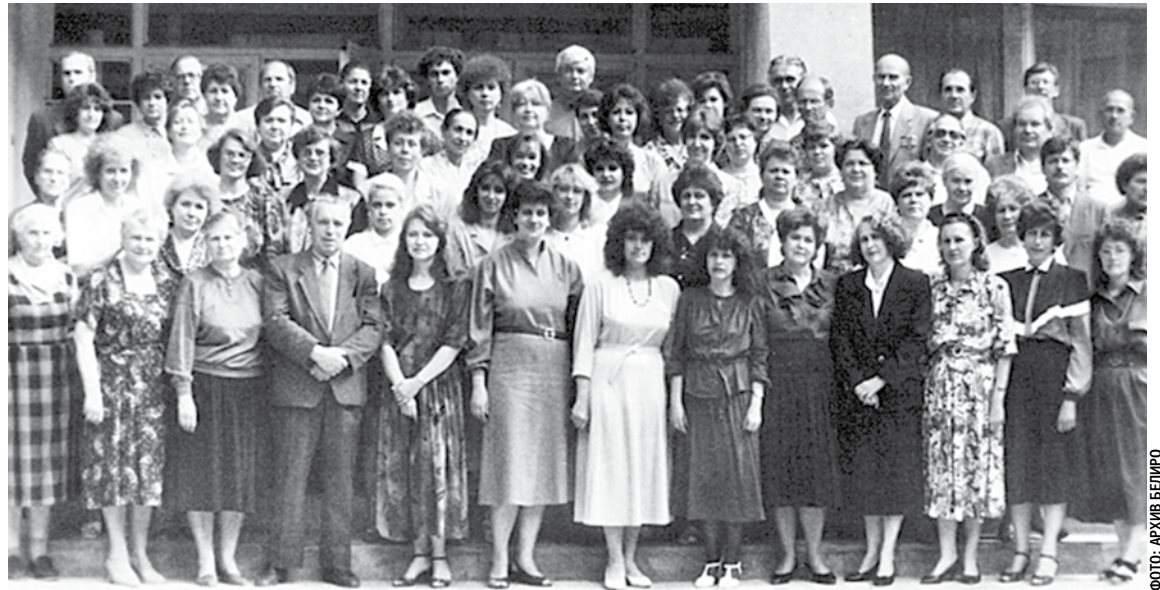
Коллектив Белгородского областного института усовершенствования учителей, 1994 год

Благодаря профессионализму, преданности своему делу, большому трудолюбию, таланту преподавателей, педагогов институт развивался, успешно выполняя свою главную миссию — повышать качество образования Белгородской области. Сегодня наш институт обладает высоким потенциалом, компетентным и работоспособным профессорско-преподавательским составом, который полон творческих планов и замыслов. Надеюсь, что всё это позволит нам эффективно реализовывать как региональные, так и федеральные инициативы. Желаю всем преподавателям и сотрудникам Белгородского института развития образования радости, профессиональных побед, счастья и любви близких, душевного равновесия, интересного и плодотворного учебного года!