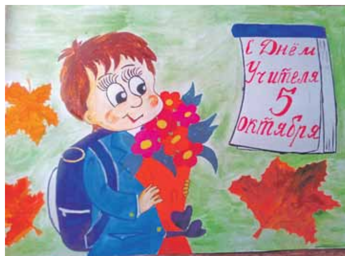
С ДНЁМ УЧИТЕЛЯ! Рисунок Валерии Шиловой (Пятницкая школа Волоконовского района)