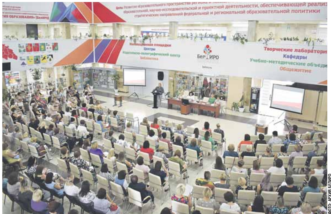
Современный, методически и технологически оснащённый центр непрерывного образования